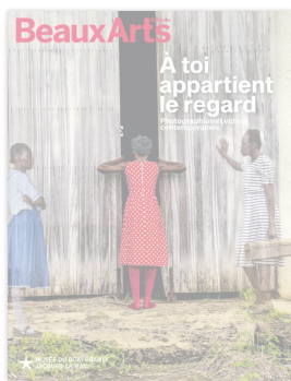
BEAUX ARTS HORS-SÉRIE