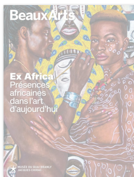
BEAUX ARTS HORS-SÉRIE

À toi appartient le regard. Photographies et vidéos contemporaines