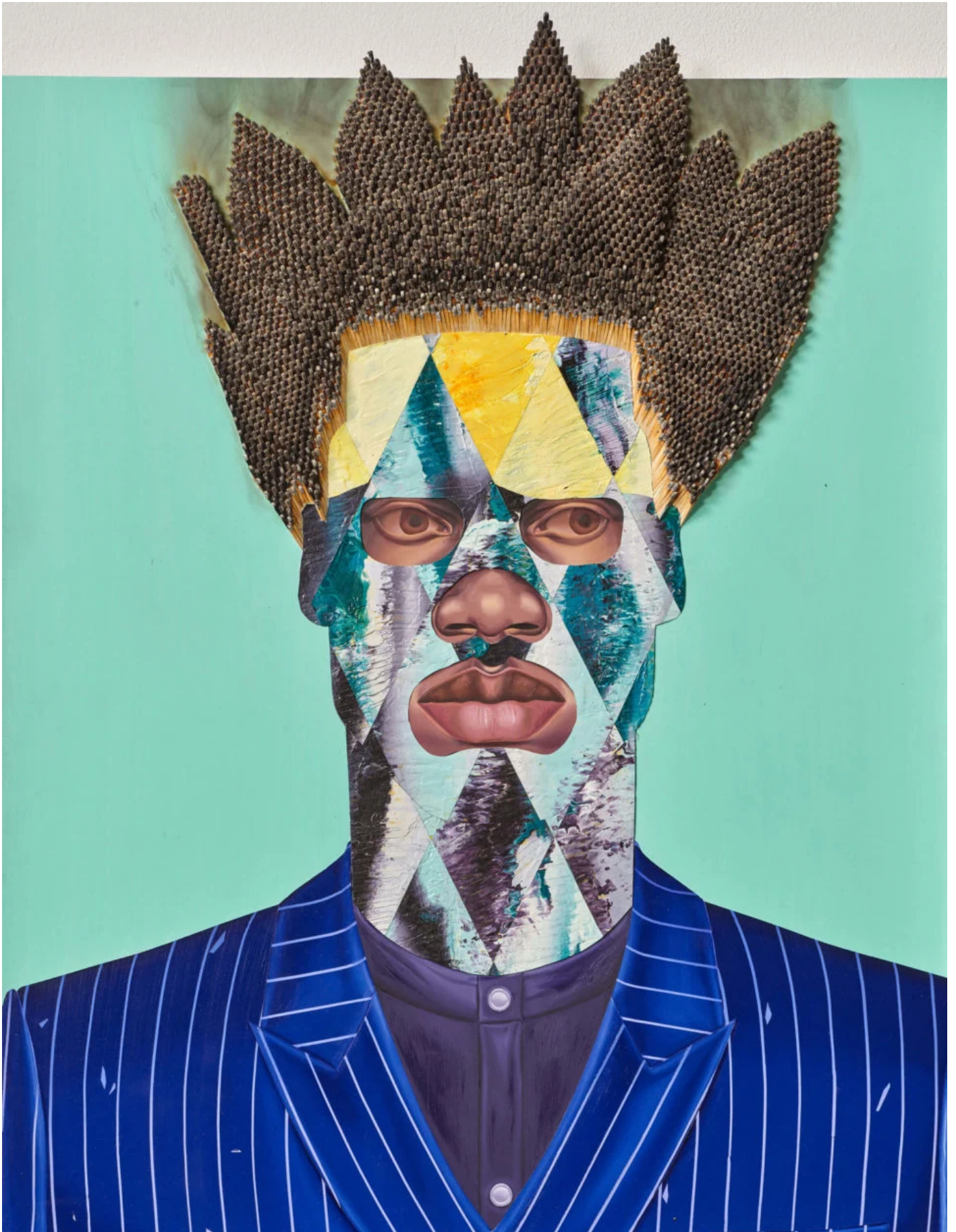
Jeff Sonhouse, Augustine's Mauvism , 2021 ⓘ

Ses personnages se répètent volontiers , comme une obsession. Pris dans un rythme sériel, ils nous parlent des multiples possibles de l'identité, double, triple.