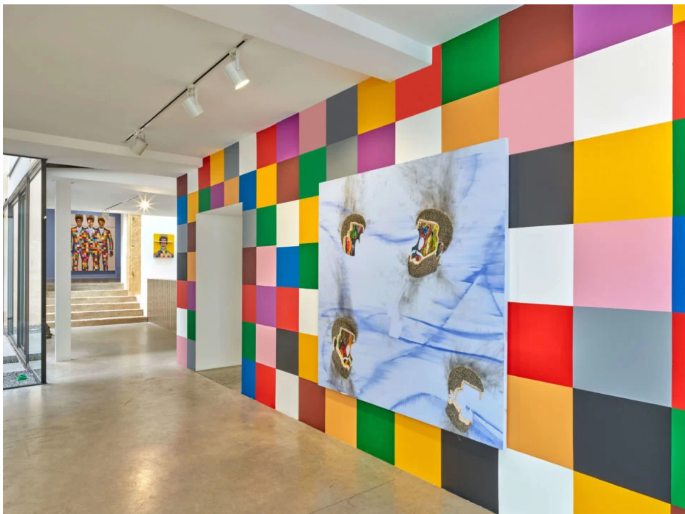
Vue de l'exposition « Bodied » à la galerie Zidoun-Bossuyt ⓘ

Ses influences tiennent à la fois de l'histoire de l'art européen et américain, et des magazines de mode masculins, dont il reprend les poses hiératiques, les allures parfaitement soignées, le mélange des genres et des modes. Ses modèles sont des figures noires, qui disent son attachement à replacer au cœur de l'art contemporain des visages oubliés, dissimulés et malmenés par l'Histoire, tout en montrant une image renouvelée, non figée.