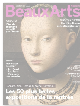
BEAUX ARTS MAGAZINE

Ex Africa – Présences africaines dans l'art d'aujourd'hui