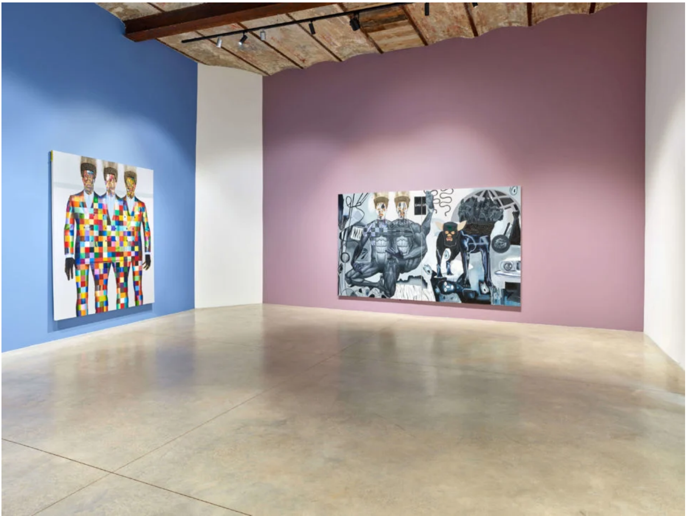
Vue de l'exposition « Bodied » à la galerie Zidoun-Bossuyt ⓘ

Ses portraits ont pour signature d'avoir des cheveux réalisés en véritables allumettes : il les pose une à une puis les enflamme, afin qu'elles laissent sur la toile des traces de brûlures noires, bien réelles. L'artiste travaille également avec de la peinture à l'huile, moins opaque que l'acrylique et dont les effets légèrement translucides lui permettent d'explorer une subtile palette chromatique. Ses personnages ne manquent en effet pas de couleurs, puisque l'artiste a pour particularité de les vêtir régulièrement de costumes d'arlequin, quadrillés de carreaux de teintes différentes – ceux-ci ont aussi inspiré la galerie pour sa scénographie, un mur entier reprenant ce motif. L'obsession arlequine lui vient de Trickster, un nom important du folklore amérindien et africain, et lui permet de faire un clin d'œil à Pablo Picasso, dont les arlequins sont fameux.